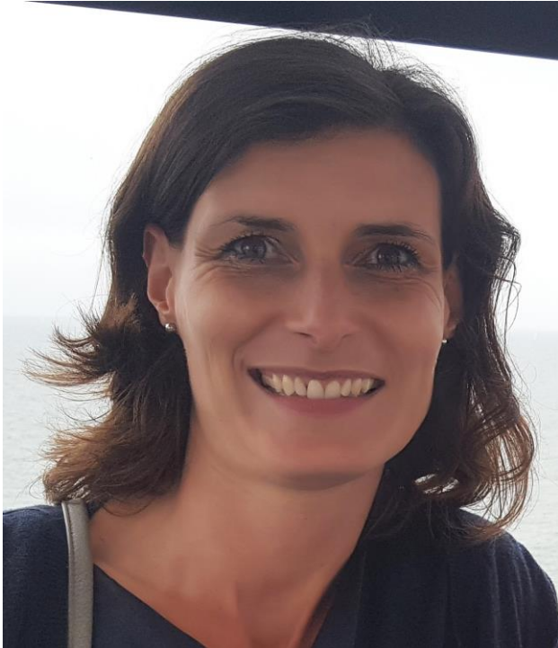
Juf Marije maandag en dinsdag