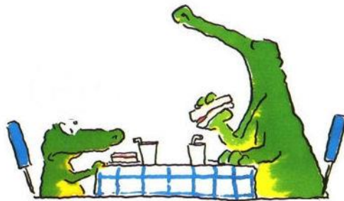
eten en drinken

Elke dag spelen we 15 minuten buiten. Na het buiten spelen eten we fruit en kijken we naar het jeugdjournaal . Zorgt u ervoor dat uw kind gezond eten meeneemt?