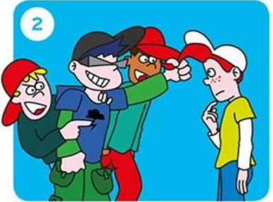
Gaat het door?