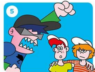
Gaat het door?