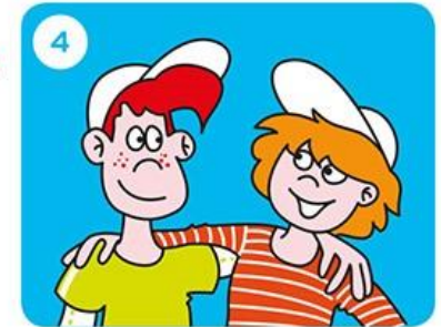
Stap naar je maatje of jouw maatje stapt naar jou.