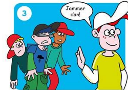
Ga iets anders doen.