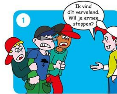
Zeg dat je het niet leuk vindt.