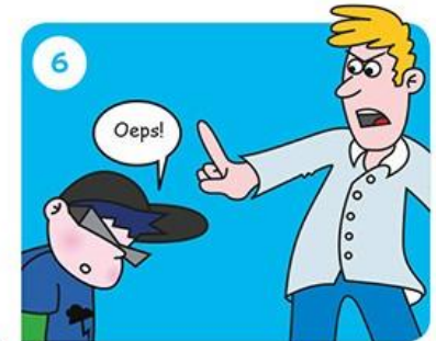
Ga naar je juf of meester. Die grijpt in.